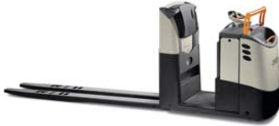
GPC 3000 Serisi Alçak Seviye Sipariş Toplayıcı Yük Kapasitesi: 2000 ve 2700 kg