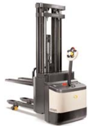
WI 2300 Serisi İlk kaldırmalı istifleyici Yük Kapasitesi: 1600 kg Kaldırma Yüksekliği: 3000 - 5230 mm