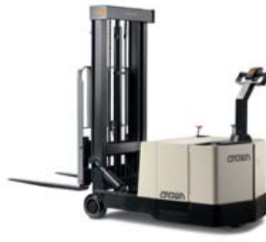
WB Serisi Karşı Denge Ağırlıklı İstifleyici Yük Kapasitesi: 900, 1350 ve 1800 kg Kaldırma Yüksekliği: 2690 - 3910 mm