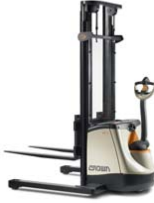
SX 3000 Serisi Denge Ayaklı İstifleyici Yük Kapasitesi: 1350 kg Kaldırma Yüksekliği: 2400 - 4250 mm