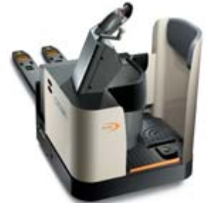
PR 4500 Serisi Oturarak Kullanımlı Transpalet Yük Kapasitesi: 3000 kg