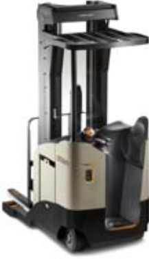
RD 5700 Serisi Çift Derinlikli Çatalı Uzanmalı Forklift Yük Kapasitesi: 1350 kg Kaldırma Yüksekliği: 5025 - 10.160 mm