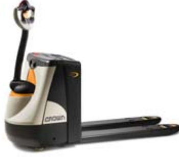
WP 2300 Serisi Elektrikli Transpalet Yük Kapasitesi: 1600 ve 2000 kg