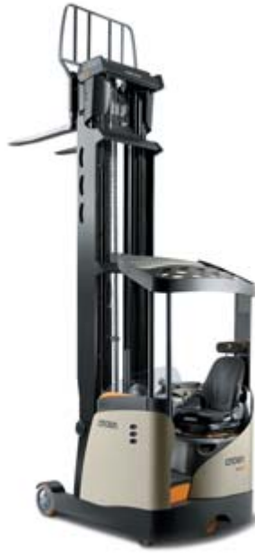
ESR 5000S Serisi S Sınıfı Çatalı Uzanmalı Forklift Yük Kapasitesi: 1600 ve 2000 kg Kaldırma Yüksekliği: 4440 - 12.000 mm