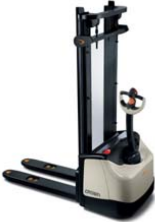
WF 3000 Serisi Paletli İstifleyici Yük Kapasitesi: 1000 ve 1200 kg Kaldırma Yüksekliği: 1550 - 4400 mm