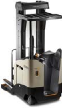
RR 5700 Serisi Çatalı Uzanmalı Forkliftler Yük Kapasitesi: 1600 ve 2000 kg Kaldırma Yüksekliği: 5025 - 10.160 mm