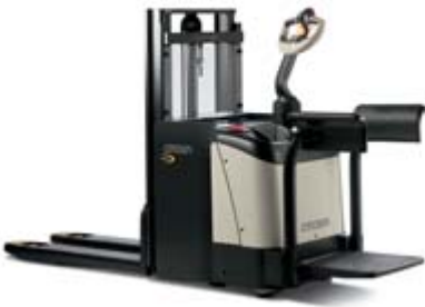
WD 2300 Serisi Çift Palet Taşımalı İstifleyici Yük Kapasitesi: 2000 kg Kaldırma Yüksekliği: 1700 - 2600 mm