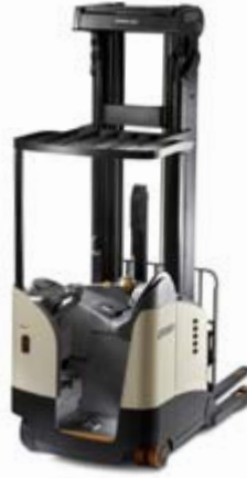
RR 5700S Serisi S Sınıfı Çatalı Uzanmalı Forklift Yük Kapasitesi: 1600 ve 2000 kg Kaldırma Yüksekliği: 5025 - 11.225 mm