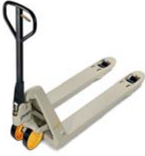
PTH 50 Serisi El Kumandalı Transpalet Yük Kapasitesi: 2300 kg