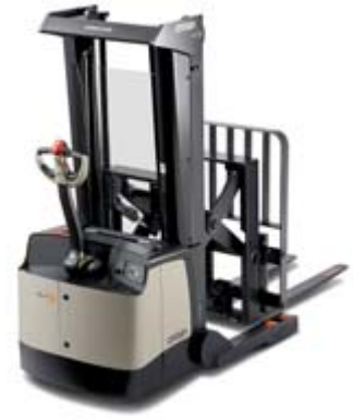
SHR 5500 Serisi Çatalı Uzunmalı İstifleyici Yük Kapasitesi: 1100, 1350 ve 1600 kg Kaldırma Yüksekliği: 3225 - 4875 mm