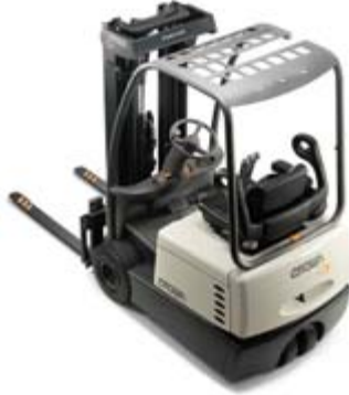
SC 4200 Serisi 3 Tekerlekli Forklift Yük Kapasitesi: 1250, 1600 ve 1800 kg Kaldırma Yüksekliği: 2890 - 7495 mm