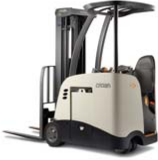
RC 5500 Serisi 3 Tekerlekli Ayakta Durmalı Forklift Yük Kapasitesi: 1500 ve 1800 kg Kaldırma Yüksekliği: 3910 - 7010 mm