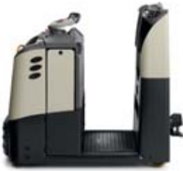
TC 3000 Serisi Çekme Traktörü Çekme Yük Kapasitesi: 3000 kg