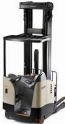
RD 5700S Serisi S Sınıfı Çift Derinlikli Çatalı Uzanmalı Forklift Yük Kapasitesi: 1350 kg Kaldırma Yüksekliği: 5025 - 11.225 mm