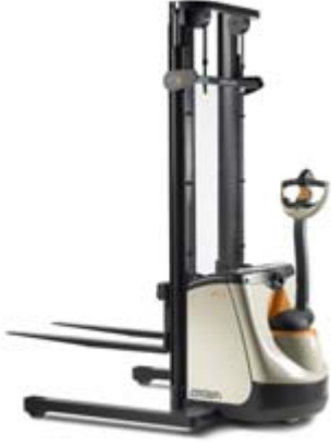
ST 3000 Serisi Denge Ayaklı İstifleyici Yük Kapasitesi: 1000 kg Kaldırma Yüksekliği: 2400 - 4250 mm