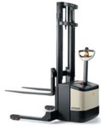
WS 2300 Serisi Denge Ayaklı İstifleyici Yük Kapasitesi: 1800 kg Kaldırma Yüksekliği: 2950 - 5180 mm