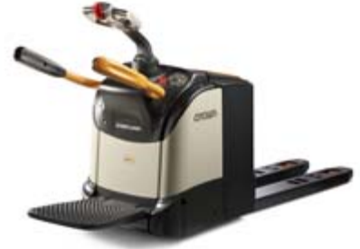
WT 3000 Serisi Elektrikli Transpalet Katlanabilir ya da Sabit Platformlu Yük Kapasitesi: 2000 ve 2500 kg