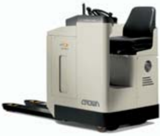
RT 3000 Serisi Oturarak Kullanımlı Transpalet Yük Kapasitesi: 2000, 2200 ve 3300 kg