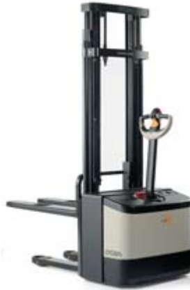
WE 2300 Serisi Paletli İstifleyici Yük Kapasitesi: 1250 ve 1600 kg Kaldırma Yüksekliği: 3000 - 5230 mm