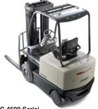
FC 4500 Serisi 4 Tekerlekli Forklift Yük Kapasitesi: 2000, 2500 ve 3000 kg Kaldırma Yüksekliği: 3200 - 7925 mm