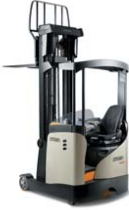
ESR 5000 Serisi Çatalı Uzanmalı Forkliftler Yük Kapasitesi: 1400, 1600 ve 2000 kg Kaldırma Yüksekliği: 4440 - 12.000 mm